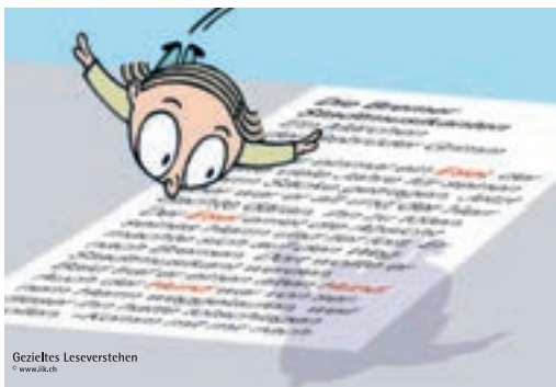
Abbildung 21 Je nach Leseziel eignet sich ein anderer Lesestil.

Beim gezielten Lesen ist das Ziel, im Text bestimmte Informationen zu finden. Dazu wird der Text überflogen. Es wird nach bestimmten Stichwörtern Ausschau gehalten. Auch in anspruchsvollen Texten kann nach einer bestimmten Information gesucht werden, ohne dass der Anspruch besteht, dass nachher der ganze Text bearbeitet wird.