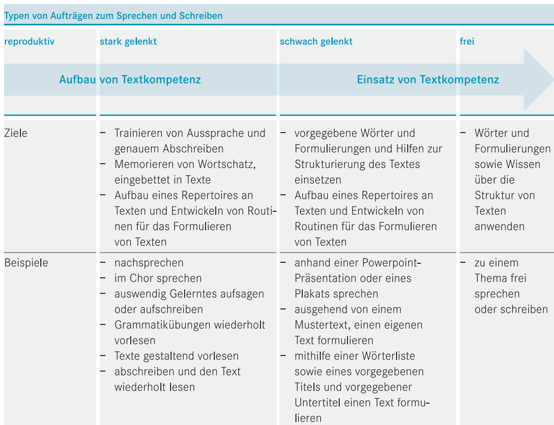
Abbildung 29 Textkompetenz kann mit gelenkten Aufträgen aufgebaut werden.

Im Unterricht ergeben sich immer wieder Situationen, in denen die Schülerinnen und Schüler etwas nachsprechen bzw. etwas abschreiben. Das, was sie dabei «produzieren», ist also nicht selbstständig formuliert, sondern «re-produziert». Beim reproduktiven Sprechen bzw. Schreiben müssen sie sich nicht auf die Konstruktion einer kohärenten Äußerung konzentrieren.